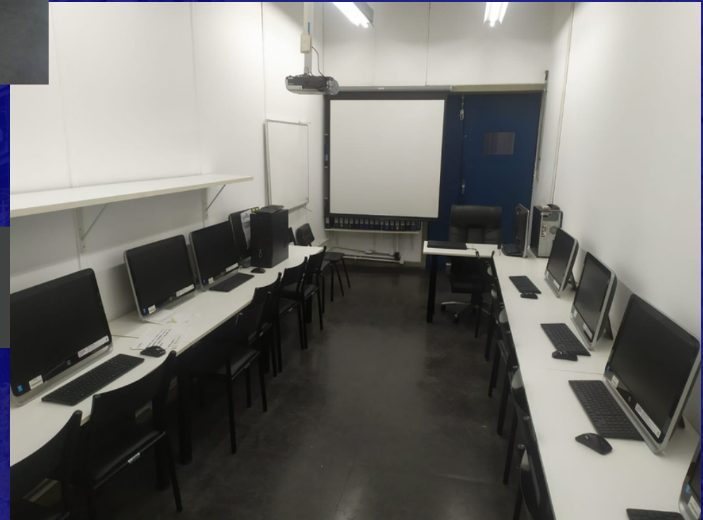
LABORATÓRIO DE INFORMÁTICA DO PPGEQ