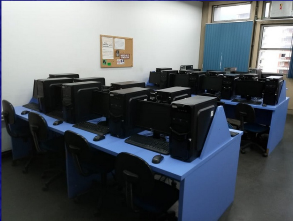
LABORATÓRIO DE ENSINO - LABGEO